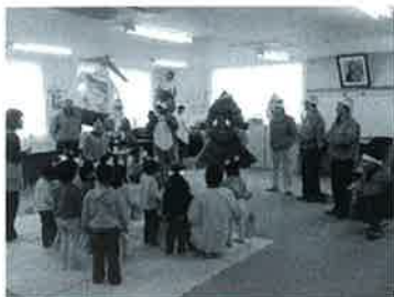
歌って踊る♪青年部員&青年部OB