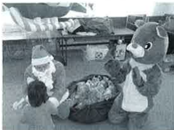
たくさんのお菓子とサンタ&トナカイ

杉戸町商工会青年部は、去る十二月二十一日(木)に毎年恒例のクリスマス会を開くために、社会福祉法人「子供の町」を訪れました。 クリスマス会は2つの事業から成っています。一つは「サンタが街にXmasプレゼント」です。児童生徒全員へXmasプレゼントを渡すために、プレゼントの袋詰めを1週間前に行いました。準備の日は、たくさんのお菓子を埋め尽くされた会議室で青年部員と青年部OBが、そのひとつひとつを手に取り、思い思いに袋に詰めていきました。 もう一つは「サンタが街にやってくる」です。在籍している児童向けに行うクリスマス会です。毎年パージュンアップしていくクリスマス会。今年は更にパージュンアップしました。 二十二日の早朝に杉戸町商工会館へ集まった青年部員と青年部OBは、トラック一杯のプレゼントを積んで出発しました。 今回もパージュンアップしたゲームに加え、「サンタ&トナカイ」と杉戸町のマスコット「すぎびよん」が参加。目をキラキラさせ、「サンタ&トナカイ」、そして「すぎびよん」に集まる子供達を見た青年部員は、自然と笑顔がこぼれていました。毎年参加している「トナカイ」は、今年も「すぎびよん」に人気を持って行かれたと、悔しさを滲ませていました。 今年は例年よりもこの事業に参加した青年部員が多かったこともあり、昨年以上に盛り上がり、無事に事業を終える事が出来ました。青年部員&青年部OBは、「来年も必ず!」と固く誓いあい今年のクリスマス会の幕は閉じました。