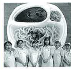
前回大会優勝 アグリカレーつけめん