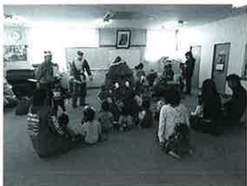
すぎびよんとクリスマス会

今回初めてクリスマス会に参加した青年部員は、子供達とともに有意義な時間を過ごせたと、満足気でした。杉戸町のマスクット「すぎびよん」は来年も必ずクリスマス会に来ることを児童と固く誓い合い、今年のクリスマス会の幕は閉じました。